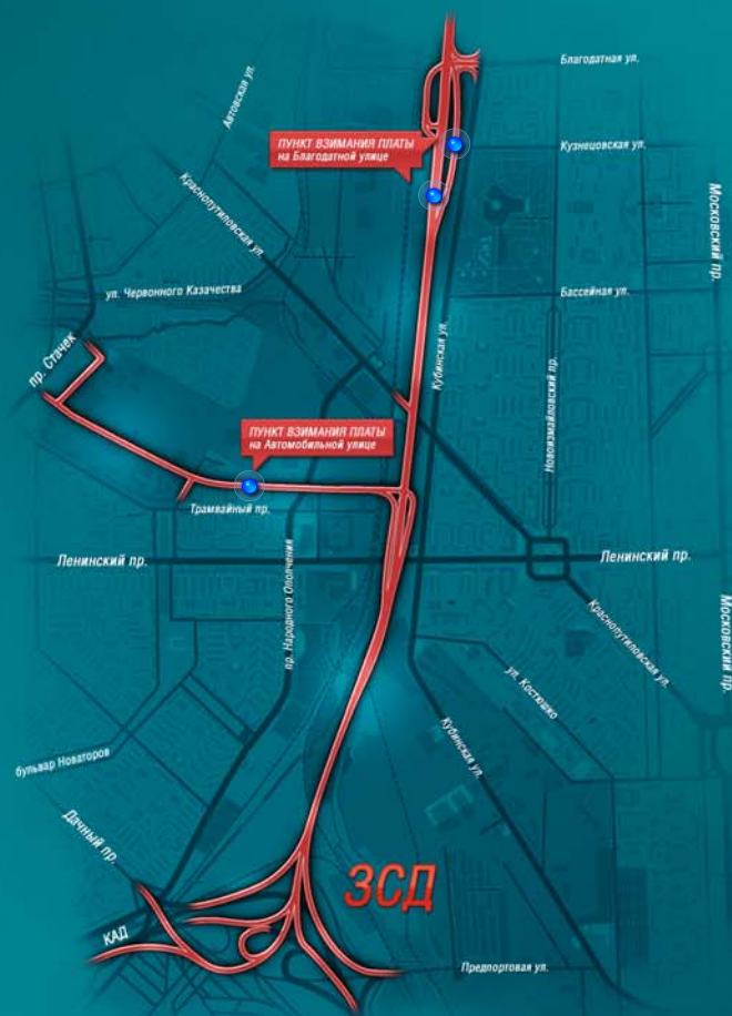
СХЕМА УЧАСТКА ЗСД ОТ КАД ДО БЛАГОДАТНОЙ УЛИЦЫ

Сбор платы будет осуществляться на двух Пунктах взимания платы (ПВП) – при въезде и съезде с ЗСД на Автомобильную ул. и на транспортной развязке в районе Благодатной ул.